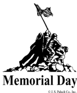
Memorial Day

MEMORIAL DAY: The parish office will be closed on Monday, May 29th in observance of Memorial Day. We wish everyone a Healthy, Safe and Happy Memorial Day. May we remember with pride and in prayer all the men and women who fought and gave their lives for our country.