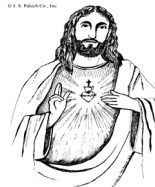
Most Sacred Heart of Jesus

DIA CONMEMORACION: La oficina estará cerrada el Lunes 29, de Mayo, en observación al Día de Conmemoración. Deseamos a todos nuestros feligreses un seguro y feliz Día de Conmemoración y recordemos con la oración a todos los hombres y mujeres quienes combatieron y dieron sus vidas por nuestra nación y nuestra libertad.